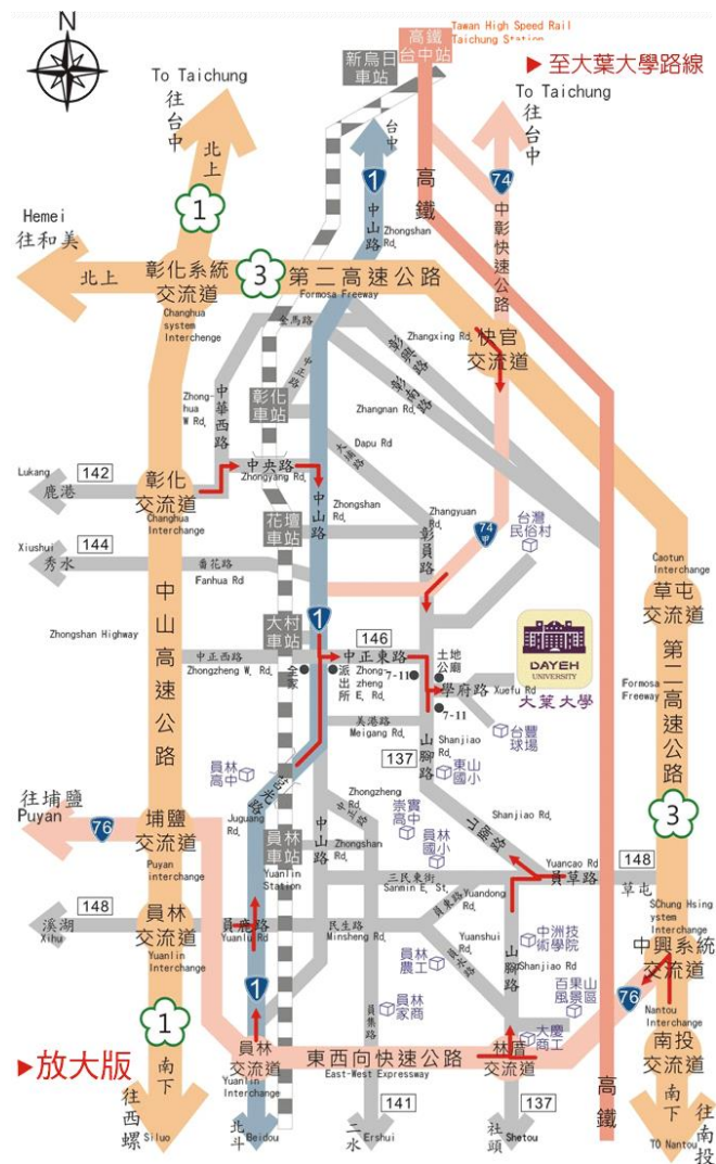
大葉大學交通路線圖：