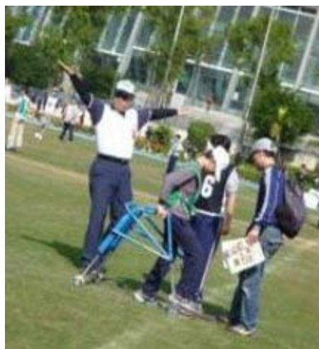
使用行動輔具之擊球員，若擊出超過 9 公尺即判 1 壘安打，可慢跑上壘得分。