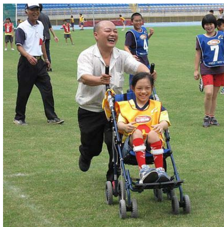
輪椅者跑壘時可加派 1 名助推員協助跑壘。